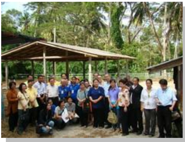
ศ.นพ.ประเวศ วะสี เยี่ยมชม องค์การบริหารส่วนตำบลปากพูน

และที่สำคัญ ท่านนายกฯ ได้เล่าเพิ่มเติมให้ฟังอีกว่า ตำบลปากพูนมีขีดความสามารถในการเป็น ศูนย์การเรียนรู้ เครือข่ายอบต. ในจังหวัด นครศรีธรรมราชอีกด้วย โครงการนี้ได้รับการสนับสนุนจาก สสส. อบต. ใดยอยากจะมาเรียนรู้เรื่องใดที่ตำบลมี ก็สามารถแวะเวียนมาเยี่ยมเยียนที่ อบต. ปากพูนได้ ซึ่งคุณหมอประเวศ วะสี ท่านให้ความสำคัญและเดินทางมาเยี่ยมเยียนบ่อยครั้ง และเมื่อไม่กี่วันก่อน เรื่องราวของตำบลปากพูนได้มีโอกาสเผยแพร่ในหน้าหนังสือพิมพ์ สามารถติดตามรายละเอียดได้จาก www.pakpoon.com