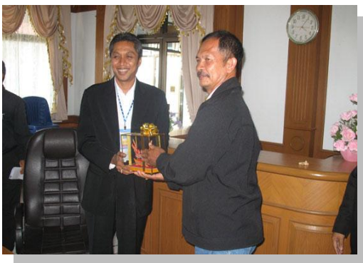
อบต.บานา จ.ปัตตานี ศึกษาดูงาน การถ่ายโอนภารกิจสถานีอนามัย ที่ อบต.ปากพูน จ.นครศรีธรรมราช

การเรียนรู้ร่วมกับเครือข่ายอื่นๆ เช่น มูลนิธิเพื่อเด็กพิการ สหทัยมูลนิธิ ถ้าเป็นเวทีของเด็ก จะมีตัวแทนของเด็กไป อบต.ไม่ได้จัดเวทีให้เด็กได้แสดงออก แต่จะเป็นเวทีวิชาการ และกีฬามากกว่าที่จะให้พื้นที่เด็ก อบต. ก็อาศัยเรียนรู้จากกลุ่มต่างๆ ที่มาทำงานร่วมกัน..”