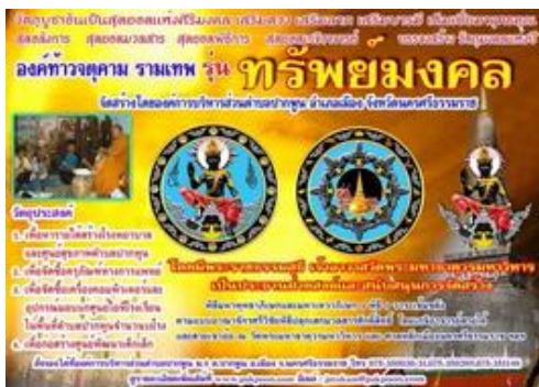
องค์ท้าวจตุคามรามเทพ รุ่น "ทรัพย์มงคล" จัดสร้างโดย อบต.ปากพูน