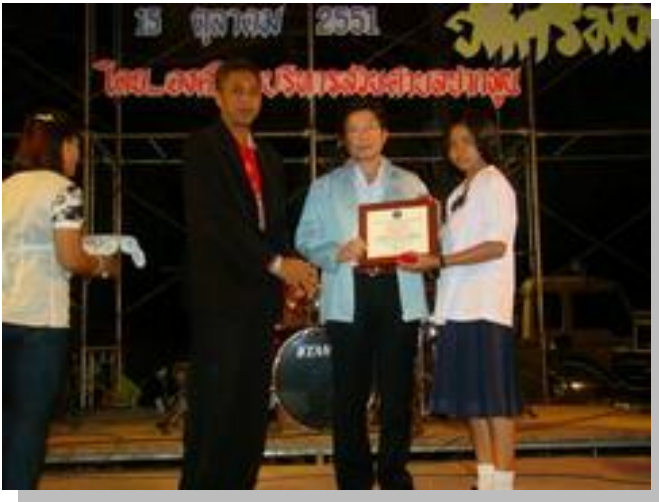
มอบรางวัลคนดีศรีแผ่นดิน ในงานลากพระ ต.ปากพูน ประจำปี 2551

“...เราเคยมีปัญหาเรื่องการเรียนรู้ของเด็กและเยาวชนในตำบล ซึ่ง พบว่าปัญหาเหล่านี้เกิดขึ้นเป็นประจำ คือ 1) เด็กใช้เวลาว่างไม่เป็นประโยชน์ 2) เด็กที่ยังอ่านหนังสือไม่ออกเขียนไม่ได้เยอะมาก และเด็กพวกนี้เมื่ออ่านไม่ ออกเขียนไม่ได้ตั้งแต่ชั้นประถม (ช่วงชั้นที่ 1-2) พอไปเรียนต่อมัธยมปรากฏว่า เขาก็อ่านไม่ออกเขียนไม่ได้ เขาจะเรียนตามเพื่อนไม่ทันและต้องลาออกจาก โรงเรียนกลางคัน...”