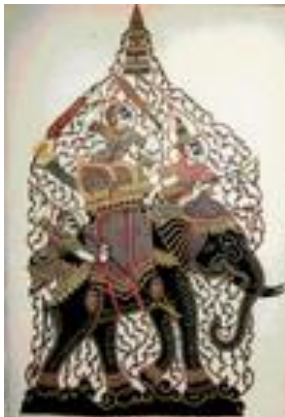
กลุ่มแกะหนังตะลุง หมู่ที่ 5 ต.ปากพูน อ. เมือง จ.นครศรีธรรมราช

ส่วนเด็กที่น่าสนใจเป็นพิเศษคือ เด็กที่ออกจากสถานพินิจ อบรม.ก็นำเรื่องเหล่านั้นมาสืบค้นว่า เหตุผลใดที่เด็กก่อปัญหาแบบนี้ ถ้ามวลี่มีส่วนใหม่ ลี่ก็มีส่วน แต่ว่าเราจะห้ามไม่ให้เด็กดูสื่อเป็นไปไม่ได้ อบรม.ได้จัดอบรมเข้าค่าย ทำกิจกรรมที่จะให้เขาเลิก ละ ปัญหายาเสพติด โดยมีวิทยากร เช่น ตำรวจ ครู เจ้าหน้าที่อนามัย ไม่ได้เน้นในด้านวิชาการ เน้นกิจกรรมที่ให้เด็กมีความสนุกสนานมากกว่า...”