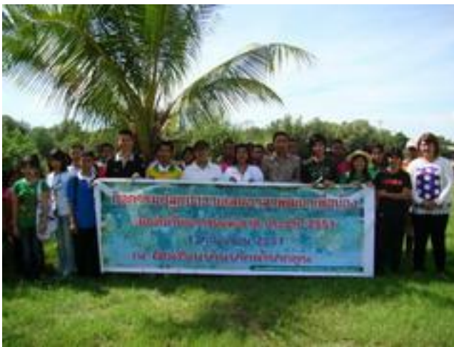
กิจกรรมปลูกป่าอาสาพัฒนาเพื่อห้องเรียนในวันเยาวชนแห่งชาติ ประจำปี 2551

ตัวอย่างเช่น นักเรียนที่ถูกให้ออกจากโรงเรียนในช่วงชั้น ม.1 หรือ ม.2 เมื่อเด็กออกจากโรงเรียนแล้ว ทาง อบต. ต้องเข้าไปรับช่วงต่อ โดยเอามาจัดการเรียนรู้ตามแผนการเรียนรู้ เมื่อครบเวลาและหลักสูตรแล้ว จึงค่อยไปทดสอบกับเด็กในโรงเรียน ให้สถานศึกษาที่อยู่ในท้องถิ่นทดสอบให้ โดยไม่ต้องไปเรียนในระบบโรงเรียนก็ได้ ถ้าแนวทางที่ออกแบบไว้ มีผลออกมาตามที่คาดการณ์ก็จะช่วยแก้ปัญหาเด็กไม่ได้เรียนต่อหลังจากถูกให้ออกจากโรงเรียนได้ในระดับหนึ่ง