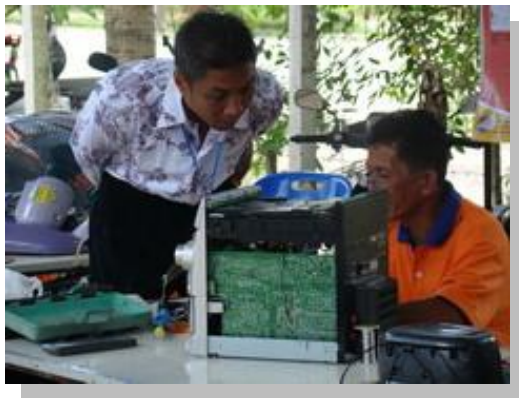
เยี่ยมชมศูนย์ซ่อมสร้างเพื่อชุมชน ต.ปากพูน

กิจกรรมนี้ทางตำบลได้ประโยชน์หลายอย่างจาก อสม.ใหญ่ เพราะ นอกจากจะเรียนภาษาอังกฤษกับครูฟิลิปปินส์แล้ว ยังจะช่วยสอนภาษาไทย ให้กับลูกหลานในท้องถิ่นตนเองอีกด้วย มีวิชาอื่นๆ เช่น วิทยาศาสตร์ คอมพิวเตอร์ ขณะนี้ทาง อบต. ได้จัดสรรงบประมาณซื้อเครื่องคอมพิวเตอร์เข้า มาแล้ว