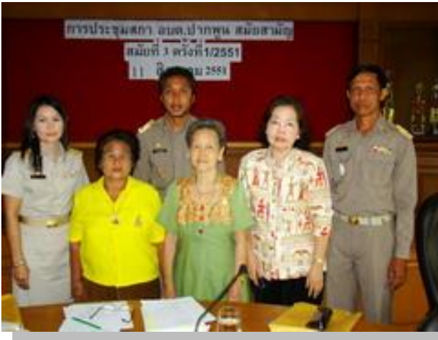
ประชุมสภา อบต.ปากพูน สมัยสามัญ สมัยที่ 3 ครั้งที่ 1/2551

ความคิดและมุมมองของท่านนายก อบต. ถ่ายทอดผ่านการพูดคุยกันในช่วงเวลาสั้นๆ ได้ทำให้เข้าใจและเห็นภาพความสัมพันธ์ที่เชื่อมโยงกันเป็นระบบ เพราะองค์กรปกครองส่วนท้องถิ่นทุกพื้นที่ทุกตำบล ล้วนเป็น "รัฐบาลท้องถิ่น" ที่ต้องดูแลทุกข์สุขของประชาชนในทุกๆ เรื่อง ตั้งแต่เกิดจนตาย ซึ่งมีน้อยตำบลนักที่สามารถจัดการและพัฒนาในเรื่องได้อย่างเป็นระบบ เพราะที่นี้ นายก รัฐบาลท้องถิ่นไม่ได้มีทีมงานที่เป็นนายก เพียงคนเดียวเท่านั้น แต่ยังมีทีมงานรัฐมนตรีประจำกระทรวงต่างๆ ในแต่ละด้าน ซึ่งเป็นแกนนำชาวบ้านที่มีใจรักและสนใจในการพัฒนาคุณภาพชีวิตของประชาชนให้สมดังวิสัยทัศน์ของตำบลปากพูนที่กำหนดไว้ มาดูกันว่า การพัฒนาคนตั้งแต่เกิดจนตาย ที่ตำบลนี้สามารถทำได้อย่างไร